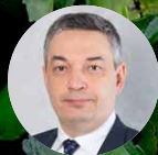
米哈伊尔·哈恰图良